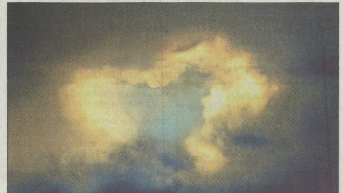
Ein Wolken-Foto von Albrecht Ropers.